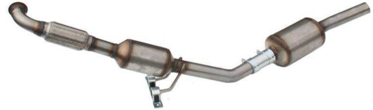
Artikel-Nr.: 02.37.025M Einbausituation mittig