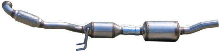
Artikel-Nr.: 02.37.025 Einbausituation rechts